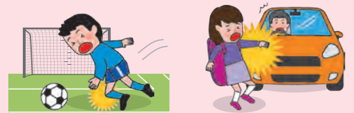
● 団体活動中のケガ ● 団体活動への往復中、車にはねられてケガをした場合

※AW・BW・CW区分にご加入の場合は、上記に加え、「団体での活動中およびその往復中」以外の事故も対象となります。ただし、熱中症、細菌性・ウイルス性食中毒を除きます。